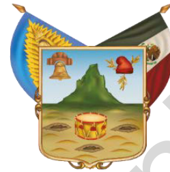
Estado Libre y Soberano de Hidalgo

LIC. JULIO RAMÓN MENCHACA SALAZAR Gobernador del Estado de Hidalgo