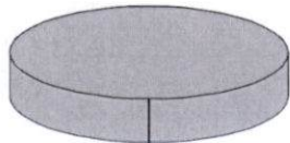
Saldo Final $0.01