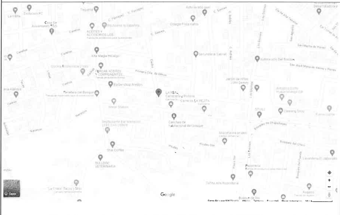
Mapa de ubicación

III. Que las instalaciones corresponden a mi domicilio fiscal, que me desempeño en las distintas instancias que contratan mis servicios y/o desde mi domicilio particular; mismo que se encuentra con servicios formales, y que no es necesariamente abierto al público, pero sí a cualquier instancia de vigilancia y/o verificación 3 .