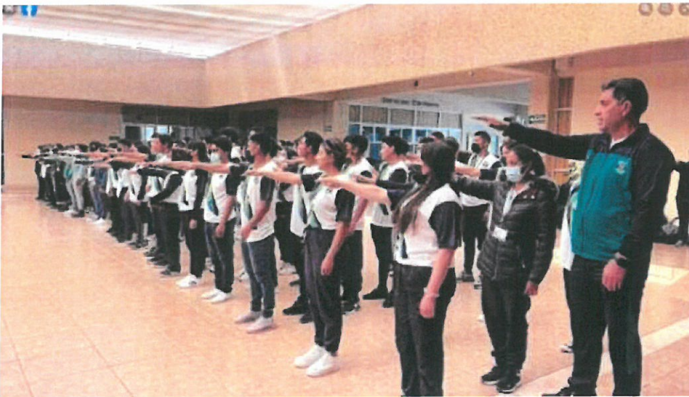
Ceremonia de abanderamiento del selectivo de futbol para ERDCUT 24 de febrero 2023, 9:00 a 10:00 hras.

Two handwritten signatures in blue ink. The signature on the left is more stylized and larger, while the one on the right is smaller and more compact.