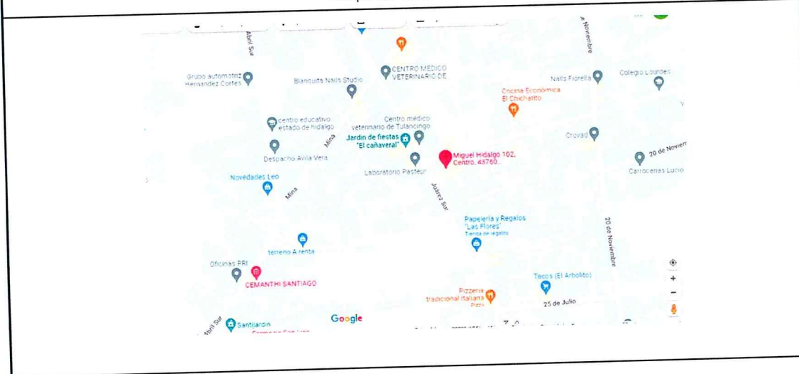
Mapa de ubicación

Hago constar que, mi actividad registrada ante el SAT, corresponde a servicios profesionales por lo que, para la prestación de los mismos, me desempeño en las distintas instancias que contratan mis servicios y/o desde mi domicilio particular, mismo que corresponde con mi domicilio fiscal; que como prestador de servicios profesionales me encuentro con registro formal y que no es necesariamente abierto al público, pero sí a cualquier instancia de vigilancia y/o verificación 3 .