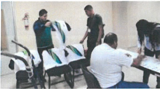
Entrega de playeras y reunión previa para regional 23 de febrero 14:30 a 16:00 horas