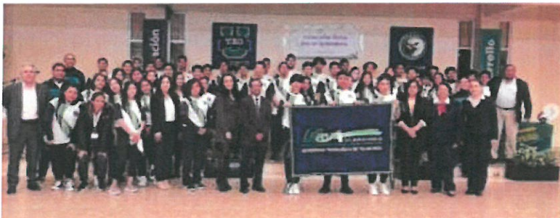
Ceremonia de abanderamiento del selectivo de fútbol para ERDCUT 24 de febrero 2023, 9:00 a 10:00 horas