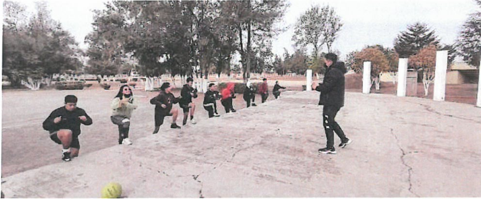
Entrenamiento de selección Unidad Deportiva sábado 18 de febrero 9:00 a 12:00 horas.