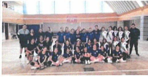
Partidos de preparación domingo 19 y 26 de febrero, Unidad Deportiva