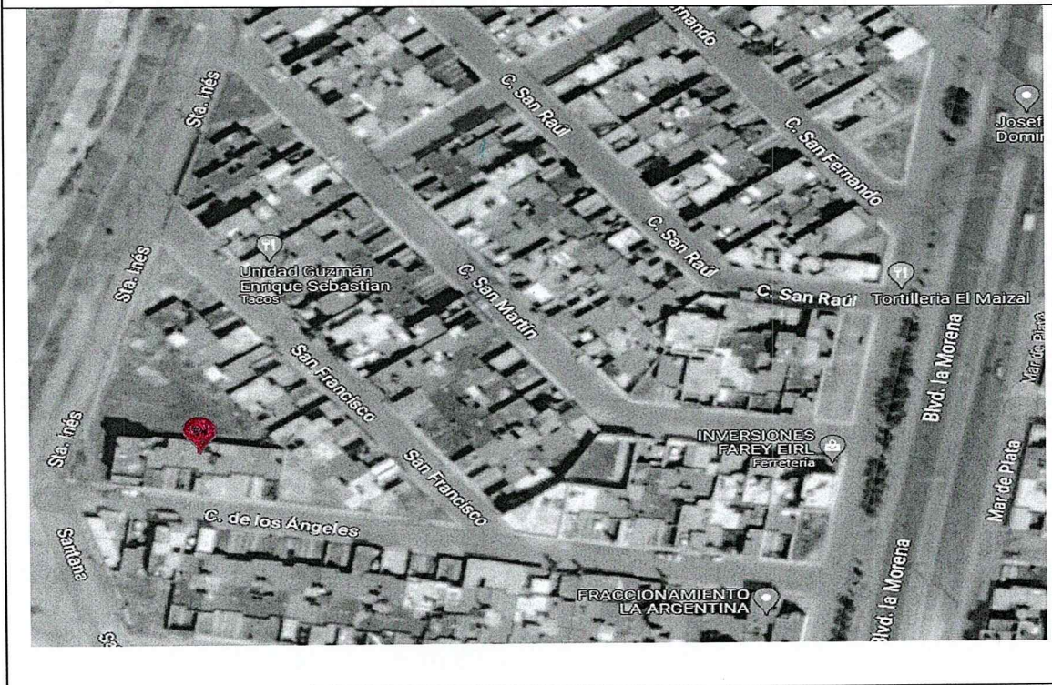
Mapa de ubicación

III. Que las instalaciones corresponden a mi domicilio fiscal, que me desempeño en las distintas instancias que contratan mis servicios y/o desde mi domicilio particular; mismo que se encuentra con servicios formales, y que no es necesariamente abierto al público, pero sí a cualquier instancia de vigilancia y/o verificación 3 .