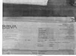
transmisiones america juan armenta .jpeg 117K