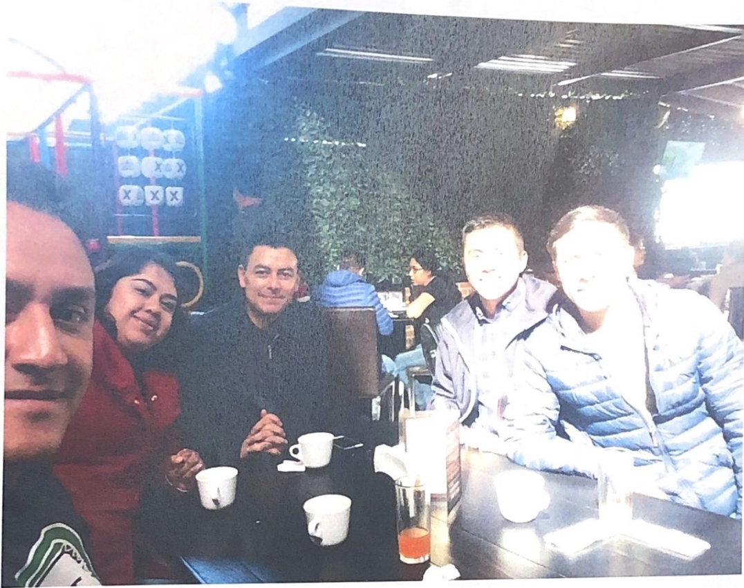
Reunión de trabajo con las unidades académicas, el 01 de marzo de 2019.