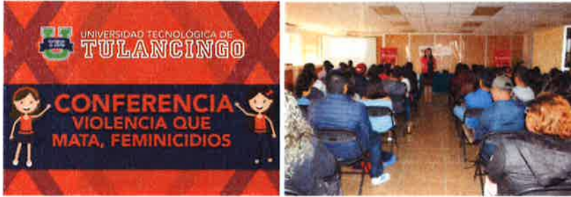
Conferencia: "Violencia" impartida a 60 estudiantes por personal del Hospital General.