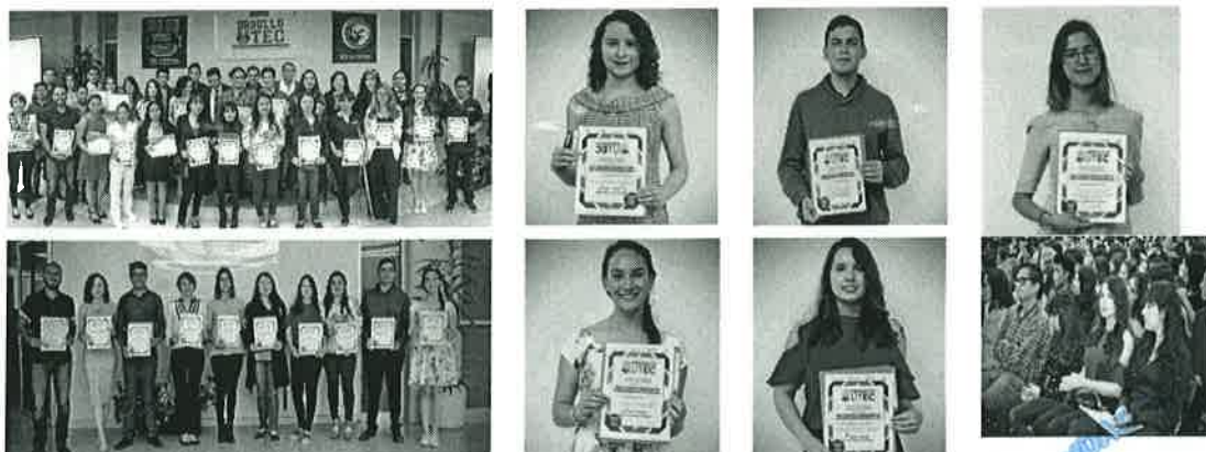
(Entrega de becas para alumnos beneficiados con Beca de Excelencia cuatrimestre mayo-agosto 2018).

En relación a las becas Federales se benefició a los siguientes alumnos: Becas MANUTENCIÓN, se benefició a 1078 alumnos, 15 alumnas con la Beca de CONACYT de Madres Mexicanas Jefas de Familia para Fortalecer su Desarrollo Profesional, 1Beca de "Un lugar para ti", 1 Beca para la Continuidad de Estudios, 215 becas del Programa Inicia Tu Carrera SEP-PROSPERA, 96 becas de 2do. Año Manutención SEP-PROSPERA.