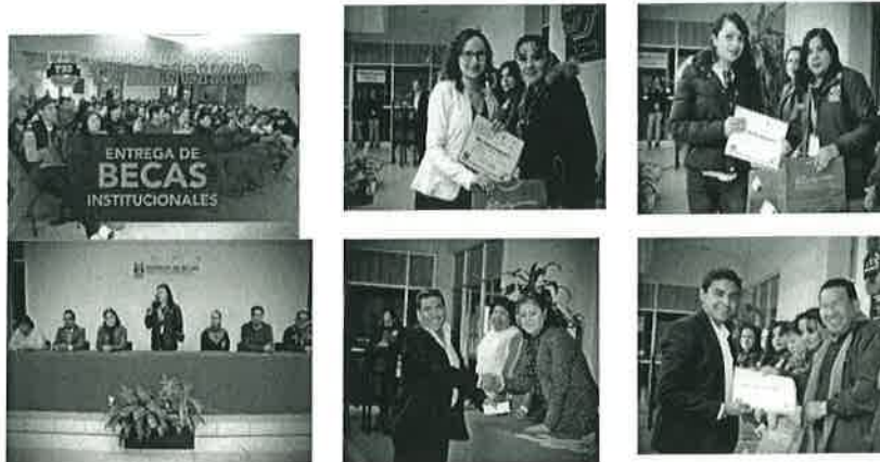
(Entrega de becas para alumnos beneficiados con Beca Institucional del cuatrimestre enero-abril 2018).

Madres Mexicanas Jefas de Familia para Fortalecer su Desarrollo Profesional, 1Beca de "Un lugar para ti", 1 Beca para la Continuidad de Estudios, 215 becas del Programa Inicia Tu Carrera SEP-PROSPERA, 96 becas de 2do. Año Manutención SEP-PROSPERA.