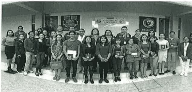
(Entrega de becas para alumnos beneficiados con Beca de Excelencia septiembre 2018).

En relación a las becas Federales se benefició a los siguientes alumnos: Becas MANUTENCIÓN, se benefició a 1280 alumnos, 15 alumnas con la Beba de CONACYT de Madres Mexicanas Jefas de Familia para Fortalecer su Desarrollo Profesional, 1Beca de "Un lugar para ti", 1 Beca para la Continuidad de Estudios, 4 Becas de Apoyo a Mujeres de Comunidades Indígenas, 79 becas de Manutención para integrantes de familias beneficiadas de PROSPERA alumnos de tercer año y 327 de la beca de Inicia tu Carrera SEP-Prospera 1er. Año, 2do. año Y 3er. Año.