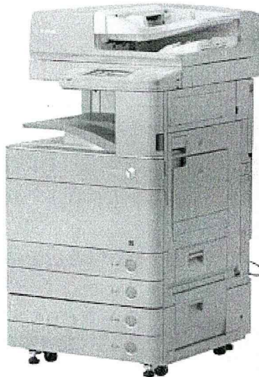
IMAGE RUNNER ADVANCE COLOR 5255

Campo Deportivo No. 202-B Col. Santa Julia. Pachuca, Hgo 771 7199760 / 7186055 TSD060804340 gventas-pachuca@tecnologiasd.com.mx