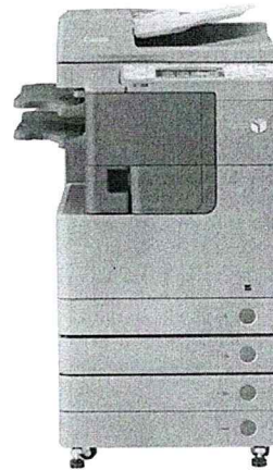
IMAGE RUNNER 1643i