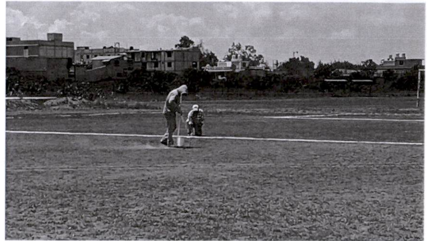
Pintado de cancha Requisición No. 320

A handwritten signature in black ink, enclosed within a hand-drawn oval. The signature is stylized and appears to read 'A.O.H.' followed by a horizontal line and a dash.