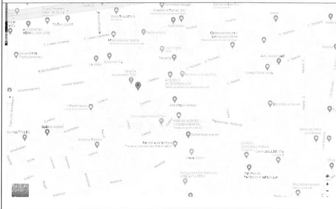
Mapa de ubicación

III. Que las instalaciones corresponden a mi domicilio fiscal, que me desempeño en las distintas instancias que contratan mis servicios y/o desde mi domicilio particular; mismo que se encuentra con servicios formales, y que no es necesariamente abierto al público, pero sí a cualquier instancia de vigilancia y/o verificación 3 .