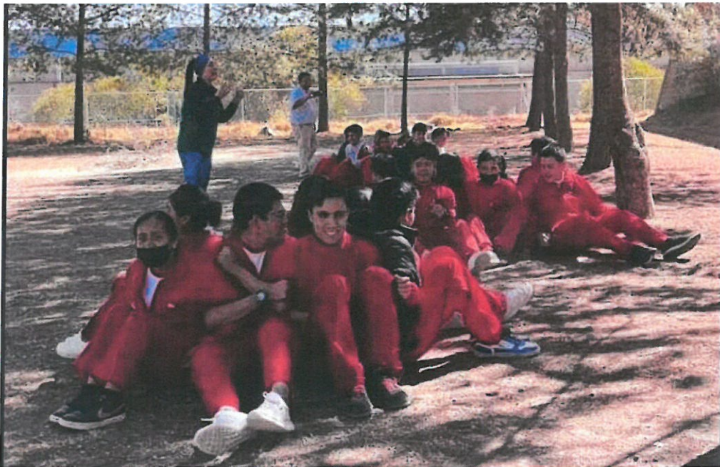
Activación física para el bachillerato de Sana Diosnicio y Alcholoja 16 de febrero 10:30 a 11:30 horas.