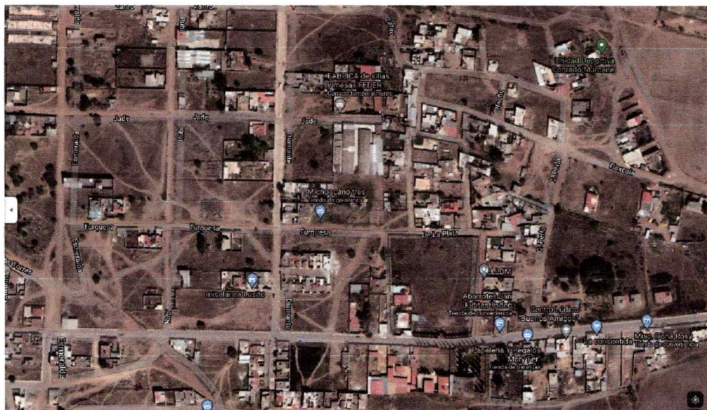
Mapa de ubicación