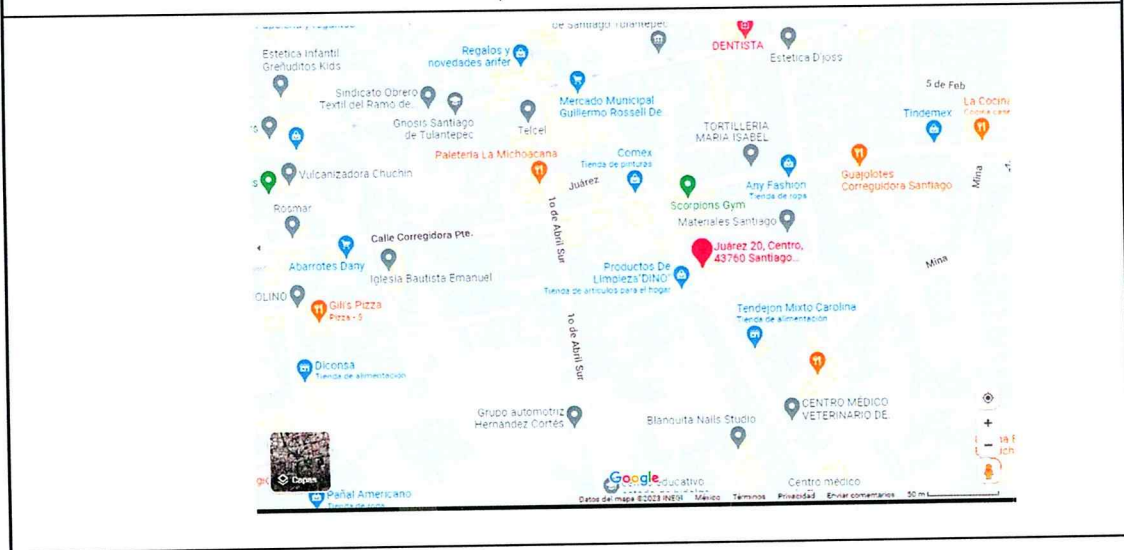
Mapa de ubicación